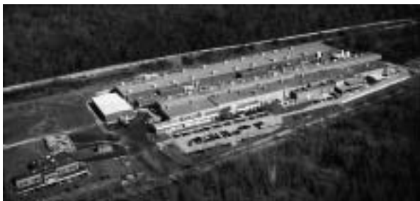
TCFテネシー工場全景

現在、FF社から引き継いだラージトウ炭素繊維の生産を継続する一方、製造設備の改造に着手しております。2005年内には炭素繊維と耐炭繊維合わせて3,400t/年の生産能力を有する工場となる予定です。TCFテネシー工場は今後、北米向けの供給ばかりでなく、東邦テナックスグループのグローバル供給基地として大きな役割を果たすこととなります。