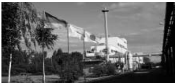
テナックスファイバース社オーバブルフ工場

新ラインの生産能力は1,500t/年で、2006年10月の稼働を目標にしております。